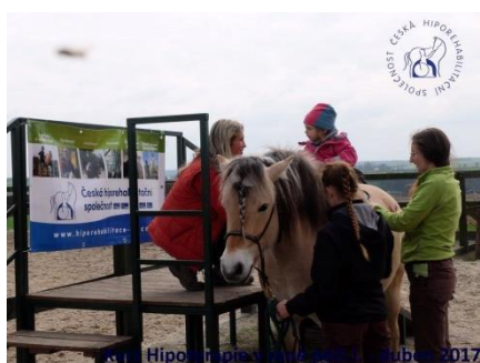
Hipoterapie v rané péči - duben 2017

Česká hiporehabilitační společnost pořádala první ročník nadstavbového kurzu „Hipoterapie pro děti v rané péči I. se zaměřením na děti ve věku od 1 do 3 let“ určený pro fyzioterapeuty a ergoterapeuty – specialisty v Hipoterapii. Teoreticko-praktická část kurzu proběhla začátkem dubna v pražském Středisku praktické výuky pro hipoterapii v rané péči Caballinus, z.s. pod vedením zkušených fyzioterapeutek Věry Lantelme a Terezy Honců.