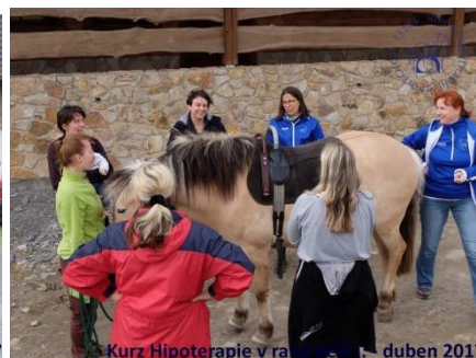
Kurz Hipoterapie v rané péči I. - duben 2017