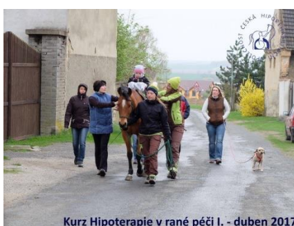
Kurz Hipoterapie v rané péči I. - duben 2017